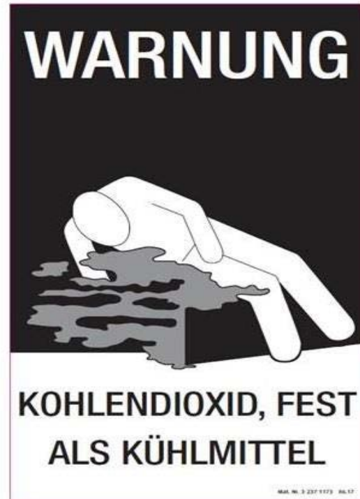
Bild 1: Warnkennzeichen für Fahrzeuge für den Transport von Trockeneis